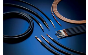
Kabel für Industrieroboter